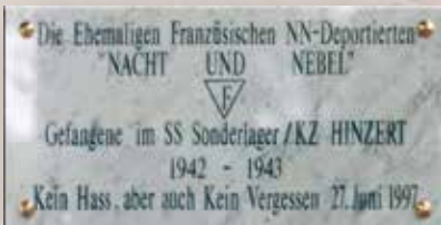
Gedenktafel ehemaliger französischer Häftlinge, angebracht an der Kapelle der Gedenkstätte am 27. Oktober 1997

Die überregionale, internationale Bedeutung der Gedenkstätte und der mit ihr im Zusammenhang stehenden „Stätten der Unmenschlichkeit“ wurde durch den rheinland-pfälzischen Landtag im September 2005 u.a. auch dadurch unterstrichen, dass ein Landesgesetz die Versammlungsfreiheit an diesen historischen Orten einschränkt. Dadurch soll eventuellen Störungen des Gedenkens an die Opfer durch neonazistische Kreise vorgebeugt werden. Die „Stätten der Unmenschlichkeit“ werden wie die Ausstellung im Dokumentations- und Begegnungshaus und der Friedhof in die historisch-politische Bildungsarbeit der Landeszentrale für politische Bildung einbezogen, vor allem unter dem Aspekt des Erinnerns an die Opfer, die für Freiheit und Menschenwürde ihr Leben lassen mussten.