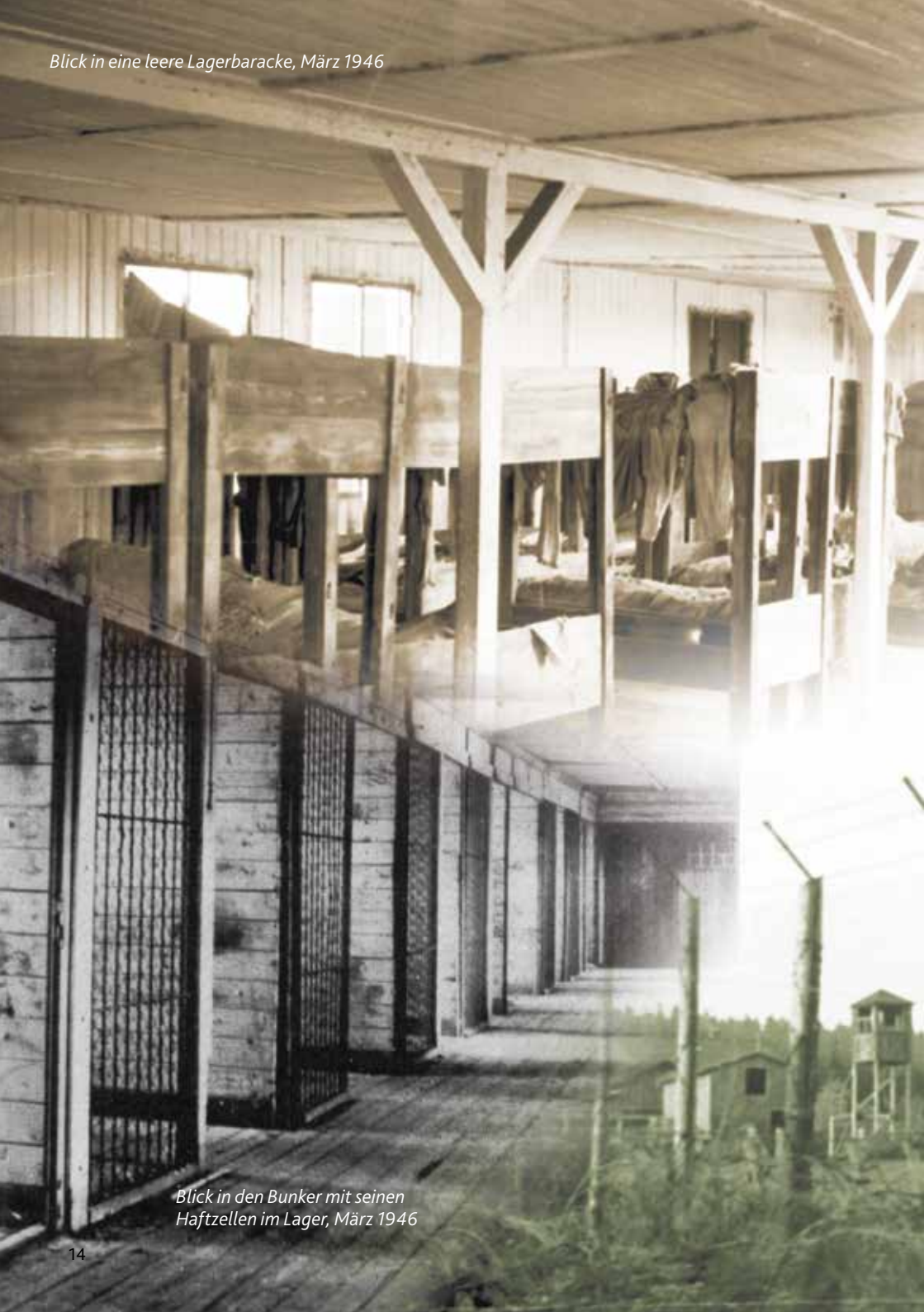
Blick in den Bunker mit seinen Haftzellen im Lager, März 1946