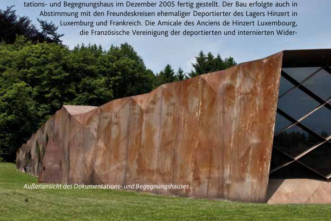
Außenansicht des Dokumentations- und Begegnungshauses

Nach der kurzen Planungs- und Bauzeit von insgesamt zwei Jahren wurde das Dokumentations- und Begegnungshaus im Dezember 2005 fertig gestellt. Der Bau erfolgte auch in Abstimmung mit den Freundeskreisen ehemaliger Deportierter des Lagers Hinzert in Luxemburg und Frankreich. Die Amicale des Anciens de Hinzert Luxembourg, die Französische Vereinigung der deportierten und internierten Wider-