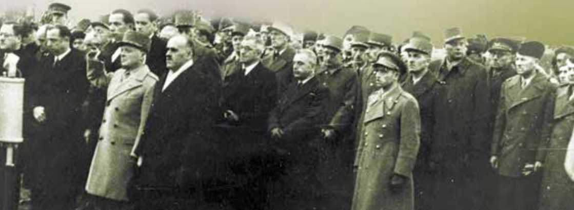
Am 4. November 1948 wurden die Kapelle auf dem Gelände der Gedenkstätte und das oberhalb des Gräberfeldes errichtete Kreuz eingeweiht. Unter den Anwesenden waren neben dem rheinland-pfälzischen Ministerpräsidenten Peter Altmeier, der französische Militärgouverneur Hettier de Boislaumont sowie der luxemburgische Unterrichtsminister Pierre Frieden, der selbst in Hinzert inhaftiert gewesen war (auf dem Foto von links nach rechts)

Der vor dem Dokumentations- und Begegnungshaus befindliche Friedhof, der sog. „Cimetière d'honneur“ („Ehrenfriedhof“), wurde 1946 von der französischen Militäradministration auf dem Gelände der ehemaligen Wachmannschaftsunterkünfte angelegt. Hier sind 217 Tote begraben, die nach Kriegsende nicht in ihre Heimat zurückgeführt werden konnten. Er wurde nach und nach zum Ausgangspunkt der Gedenkstätte. Seit 1958 pflegten Georg Baldy und in der Nachfolge sein Sohn Bernhard Baldy die Gräber. Zu ihnen hatten viele inzwischen verstorbene Überlebende des Lagers aus verschiedenen Ländern Kontakt, wenn sie an den Ort ihrer Gefangenschaft zurückkehrten, um der ermordeten Kameraden zu gedenken. Die Friedhofsanlage führte bis in die 1990er Jahre ein Schattendasein. Der Charakter des Verborgenen wurde lange Zeit noch durch die Bezeichnung „Ehrenfriedhof“ verstärkt, die bis 1994 verwendet wurde und den Hintergrund des Konzentrationslagers eher verschleierte. Erst eine viersprachige Informationstafel unter freiem Himmel, die im Jahr 1997 an der südöstlichen Ecke des Friedhofes aufgestellt wurde, erläuterte kurz den historischen Hintergrund der Anlage. Auf Initiative der Landeszentrale für politische Bildung sowie des Fördervereins Dokumentations- und Begegnungsstätte ehemaliges KZ Hinzert e.V. beschloss der rheinland-pfälzische Landtag mit Zustimmung aller vier Fraktionen im