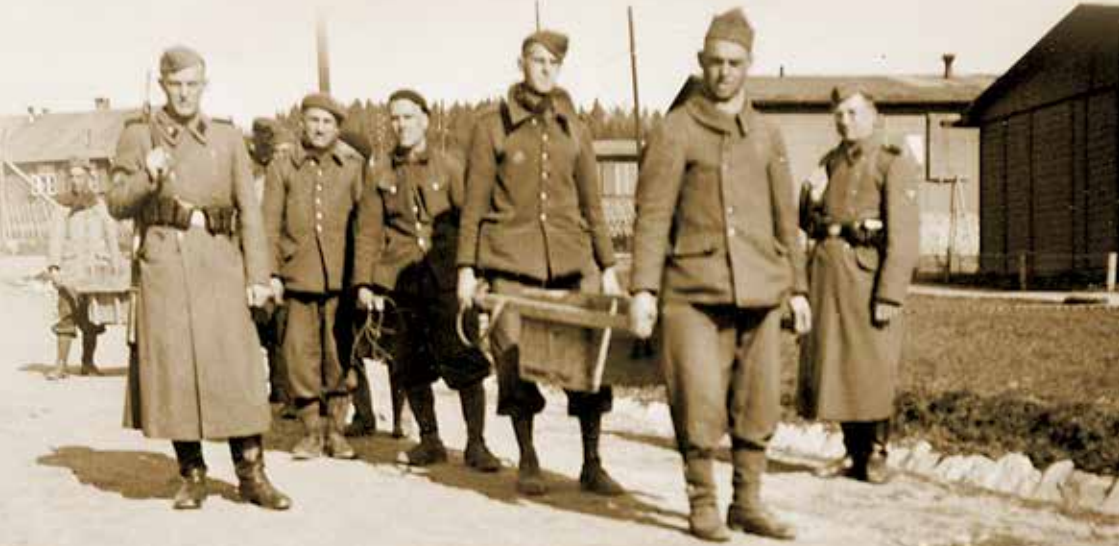
Zum Transport von Holz, Schiefer und Kohle wurden tragbare Kästen verwendet, die die Häftlinge im Laufschrift schleppen mussten. Dies ist ein gestelltes Foto, die Aufnahme stammt von einem bisher unbekanntem SS-Wachmann.

Große Häftlingsgruppen kamen vor allem aus Luxemburg. Die meisten Widerstandskämpfer dieses Landes ließ die Gestapo im nahe gelegenen Lager Hinzert einsperren. Umfangreiche Transporte von Häftlingen trafen auch aus Frankreich, Polen und der Sowjetunion in Hinzert ein. Die Gefangenen aus Westeuropa waren zumeist politische Widerstandskämpfer. Bei den osteuropäischen Häftlingen handelte es sich überwiegend um nach Deutschland verschleppte Zwangsarbeiter. Nach dem vom Oberkommando der Wehrmacht am 7. Dezember 1941 herausgegebenen „Nacht-und-Nebel“-Erlass wurden von Mai 1942 bis Oktober 1943 fast 2.000 zumeist französische, aber auch belgische und niederländische Mitglieder der nationalen Widerstandsgruppen nach Hinzert deportiert. Die „Nacht-und-Nebel“-Gefangenen (NN-Deportierte) sollten in ihrer Heimat spurlos verschwinden und unter größter Geheimhaltung nach Deutschland verschleppt werden, um dort einem Sondergericht zur Aburteilung zugeführt zu werden. Angehörige erhielten über den Verbleib der Verhafteten