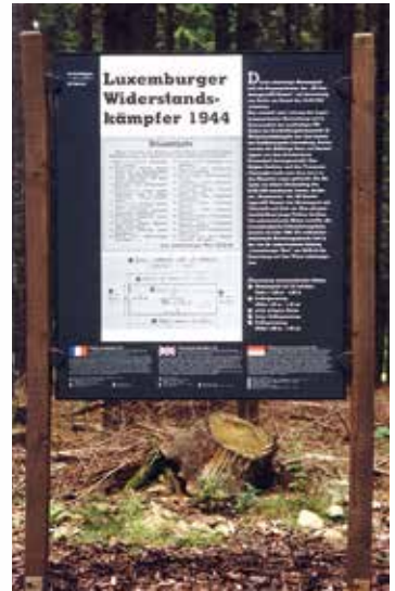
Gedenktafel für die 1944 ermordeten Luxemburger Widerstandskämpfer