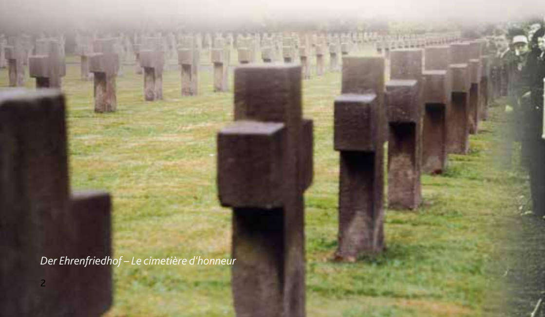
Der Ehrenfriedhof – Le cimetière d'honneur

Aufgrund seiner Funktionen im nationalsozialistischen KZ-System hatte das Lager eine europäische Dimension erhalten. Dieser internationalen Bedeutung trägt dieses Gedenkstättenhaus Rechnung, indem es vor allem an das Schicksal der Häftlinge aus verschiedenen Ländern und an die Opfer, die hier ihr Leben lassen mussten, erinnert. Es ist neben dem NS-Dokumentationszentrum Rheinland-Pfalz in der Gedenkstätte KZ Osthofen, das schwerpunktmäßig an das frühe KZ Osthofen bei Worms (1933-34) erinnert und einen Überblick über die NS-Zeit in